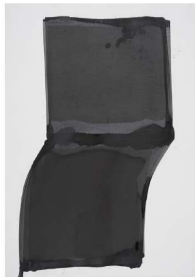
RIDEAU, 2012 Encre sur papier, 100x72 cm