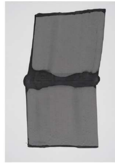
RIDEAU GRIS, 2012 Encre sur papier, 100x70 cm