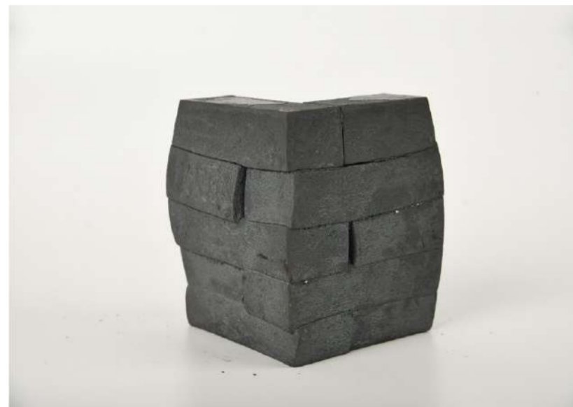
ANGLE-MUR, 2020 Acier forgé, approximativement 18x14x14 cm