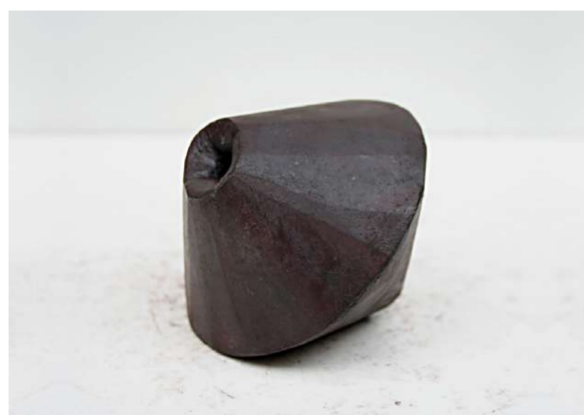
TOUPIE, 2008 Acier forgé, 10x10x10 cm