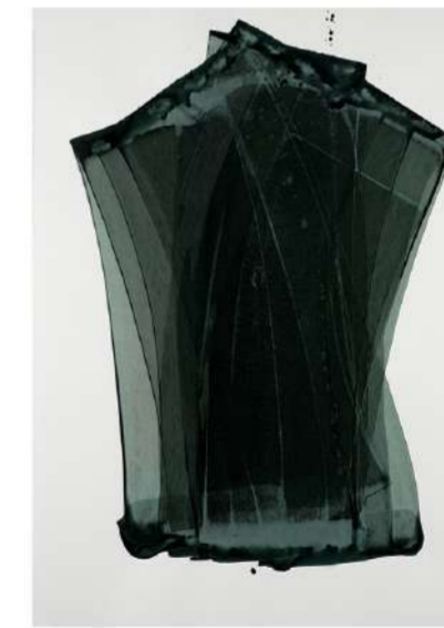
VOILE, 2014 Encre sur papier, 100x72 cm