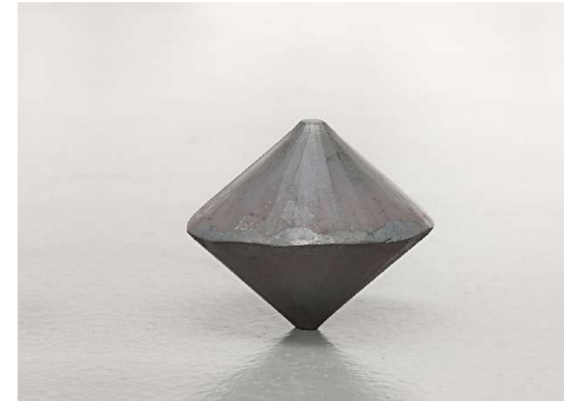
TOUPIE DERVICHE, 2012 Acier forgé, 14x14x14 cm