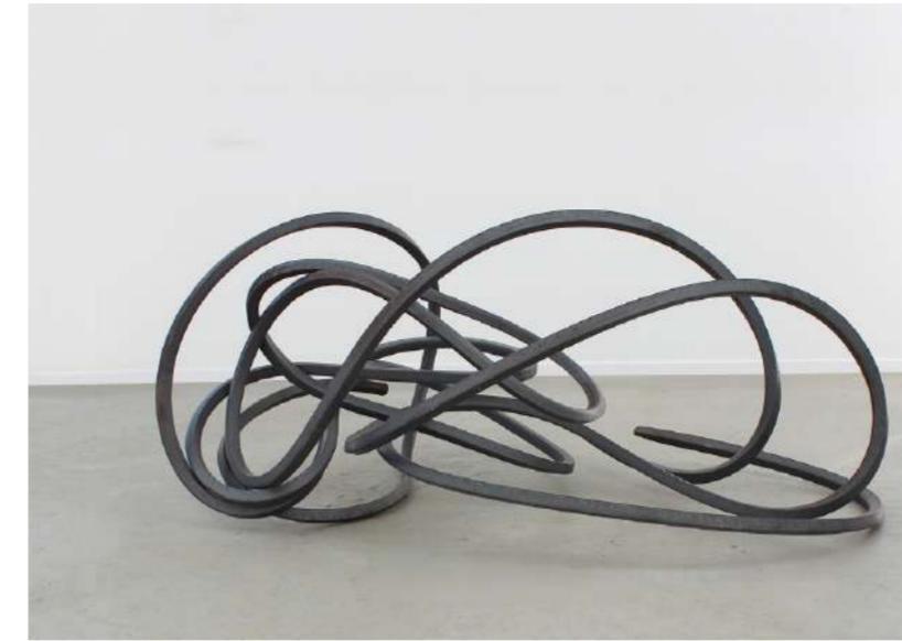
ERDLINIE 5, 2016 Acier laminé, 80x100x140 cm, 80 kg