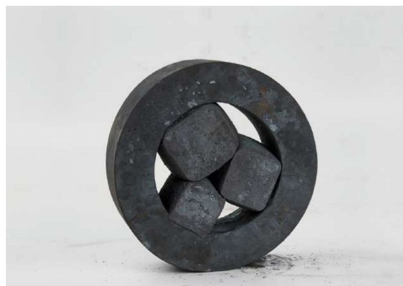
MONTURE 056, 2018 Acier forgé, 29,5x29,5x8 cm