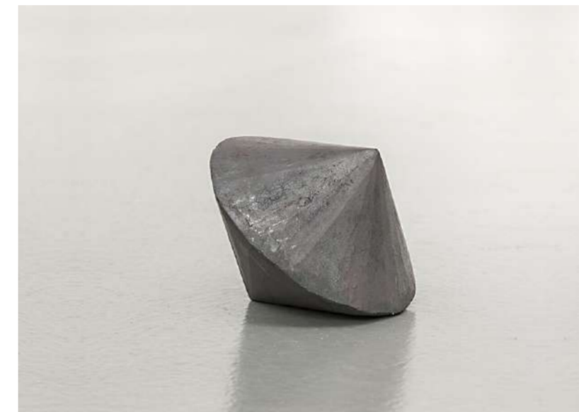
TOUPIE POINTUE, 2012 Acier forgé, 14x14x14 cm