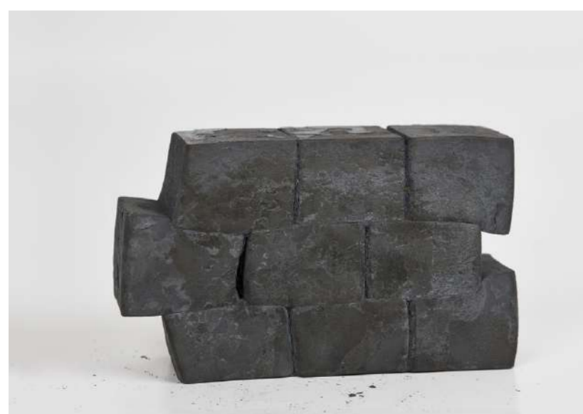
MUR, 2020 Acier forgé, 11,5x19x5,5 cm