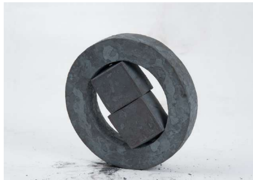
MONTURE 031, 2018 Acier forgé, 19x19x5 cm