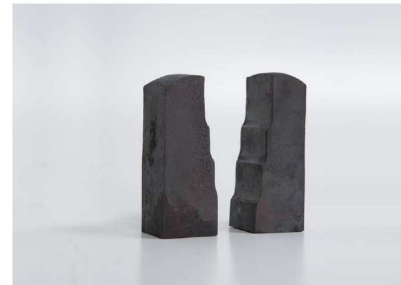
TOURS JUELLES, 2016 Acier forgé, 11x4x3,8 cm