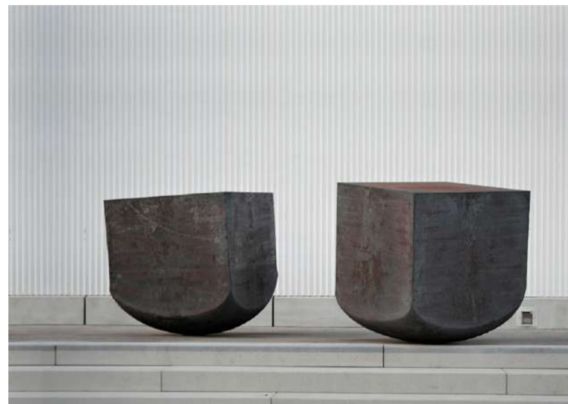
TRIBUNAL RÉGIONAL STUTTGART, STAMMHEIM (A), 2014-2018 Approximativement 20 tonnes, 130x110x100 cm