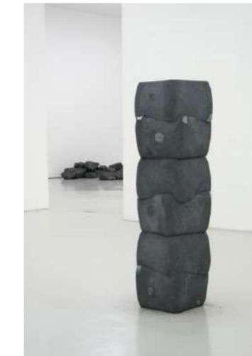
MONÁS, 2013 MUSÉE D'ART MODERNE SAINT ETIENNE (F)