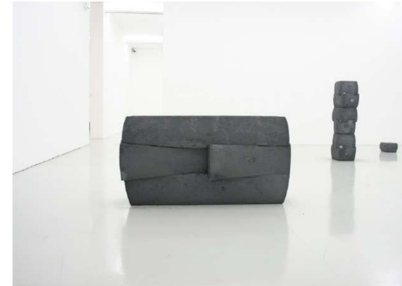
PAYSAGES, 2013 MUSEUM FÜR MODERNE KUNST SAINT ETIENNE (F)