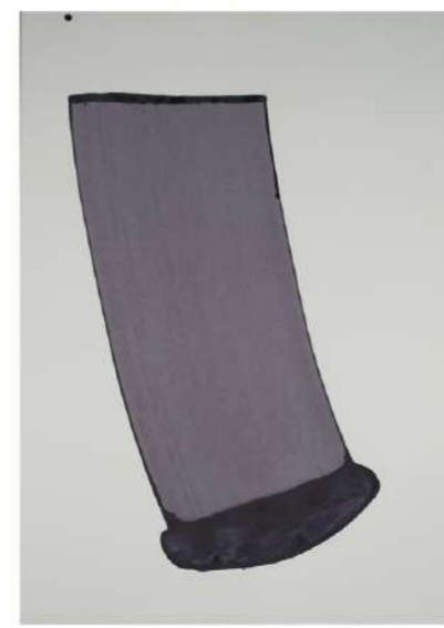
EXTENSION, 2010 Encre sur papier, 100x72 cm