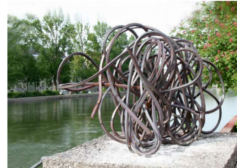
LINIE, 2008 LANDSHUT (A) Fer pur laminé, 70x70x100 cm