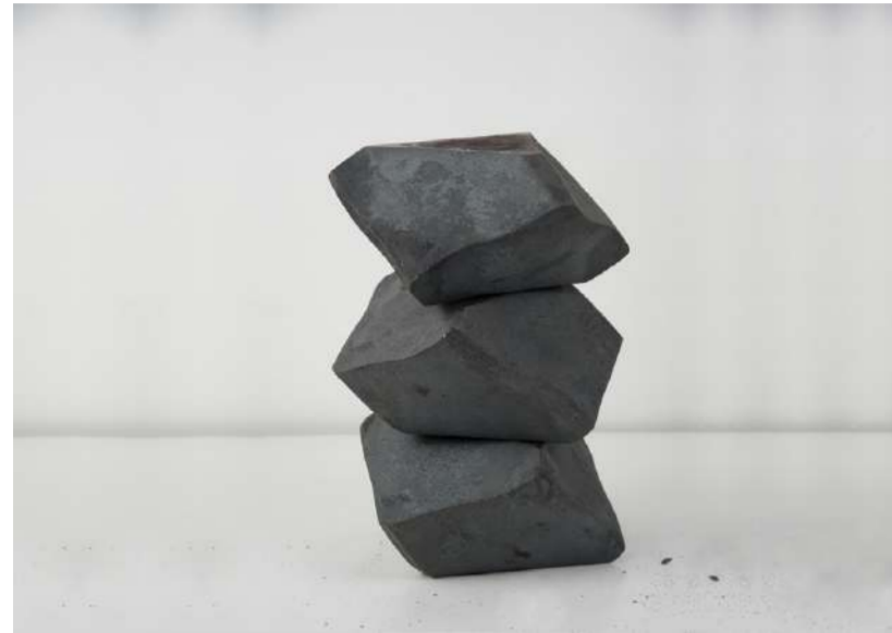
EMPILEMENTS, 2014 En trois éléments, acier forgé, 34x26x26 cm