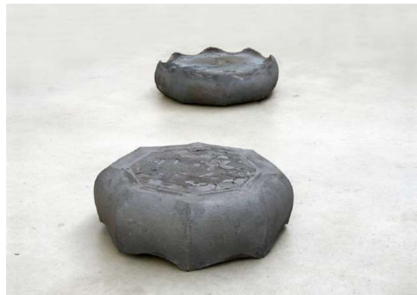
ROSE, 2014 Acier forgé, 80x80x13 cm, approximativement 0,65 tonnes