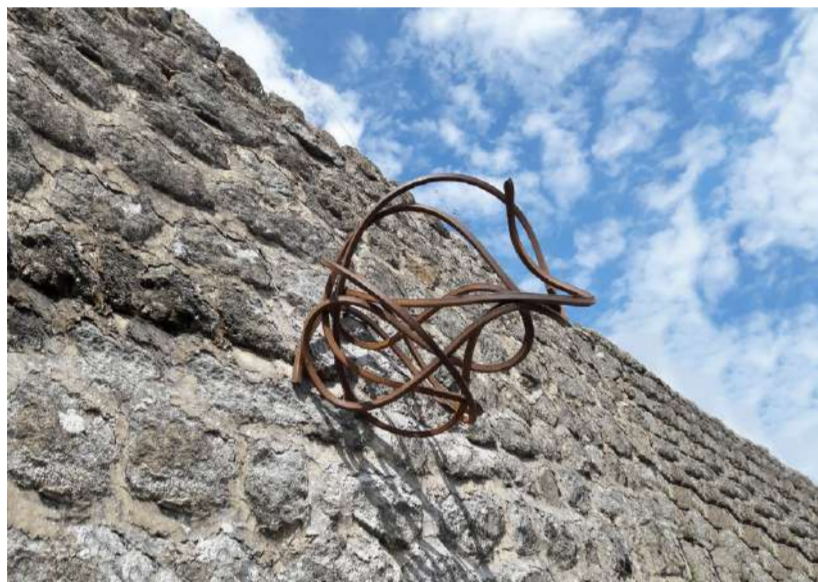
LIGNE, 2008-2021 GLUIRAS (F) Acier laminé, 50x50x70 cm