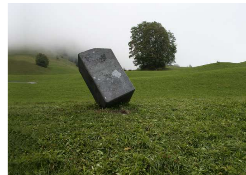
POLYEDER, 2011 GURTIS (A) Acier forgé, 130x62x62 cm, approximativement 4 tonnes