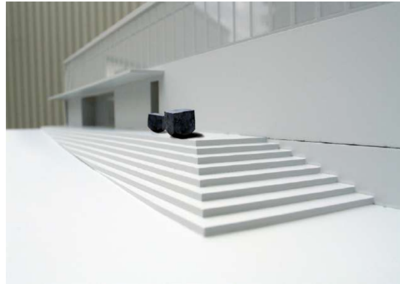
TRIBUNAL RÉGIONAL STUTTGART, STAMMHEIM (A), 2014-2018 Approximativement 20 tonnes, 130x110x100 cm