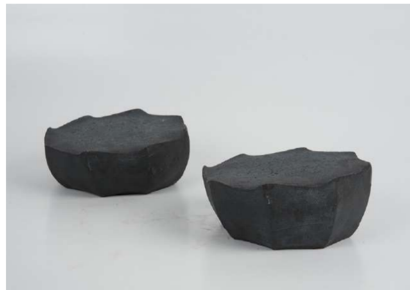
ROSE, 2015 Acier forgé, 5x13x13 cm