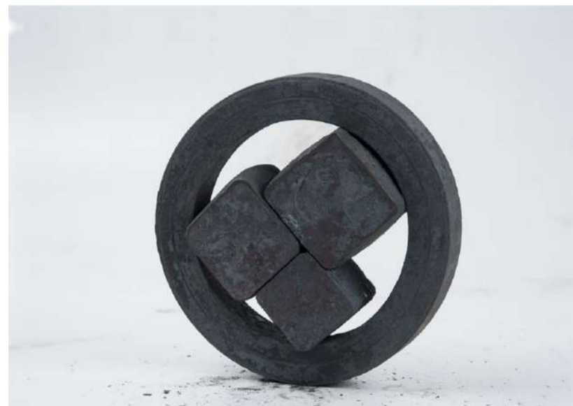
MONTURE 020, 2018 Acier forgé, 24x24x6 cm