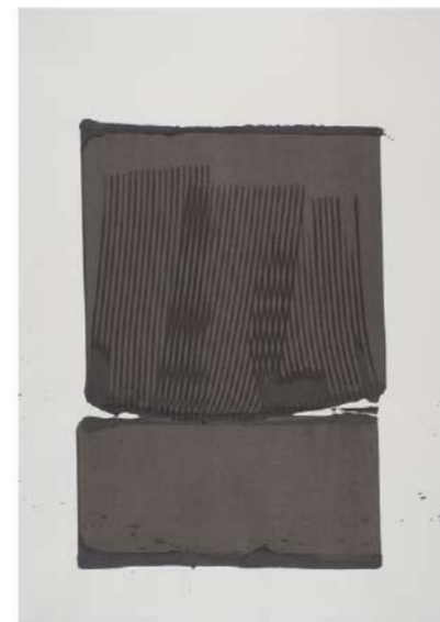
SCULPTURE STRIÉE, 2017 Encre sur papier, 100x72 cm