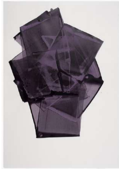
KRISTALIN, 2015 Encre sur papier, 100x72 cm