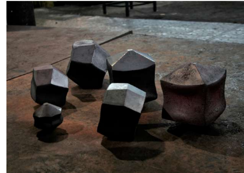
MAISONS AFRIAPPROXIMATIVEMENTINES PRISMA, 2019 Acier forgé