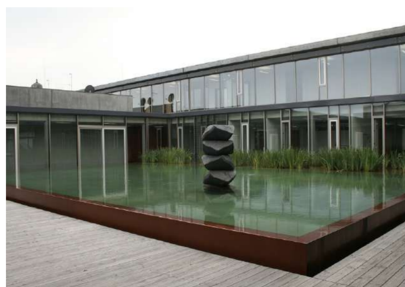
EMPILEMENTS, 2012 ÉCOLE NORMALE SUPÉRIEURE, SINGEN (A) Hauteur 3 m, 12 tonnes