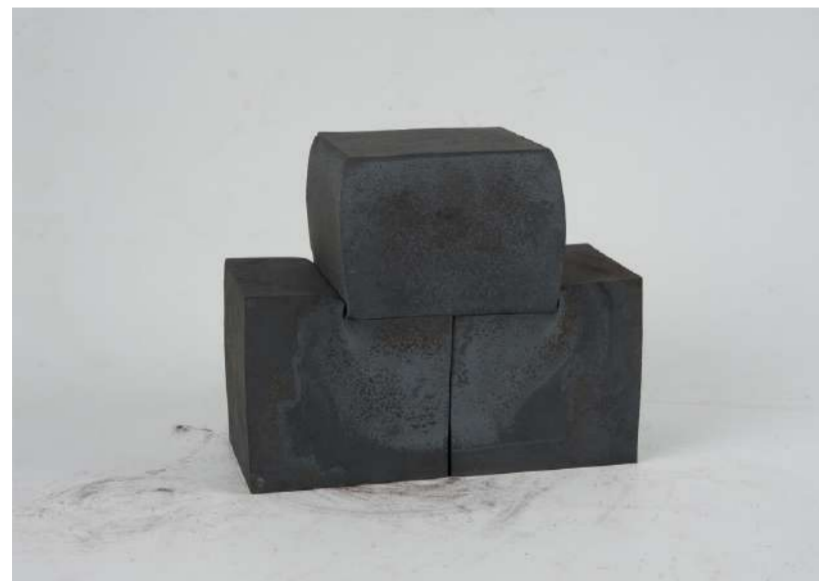
TÊTE, 2019 Acier forgé, 20x25x14 cm