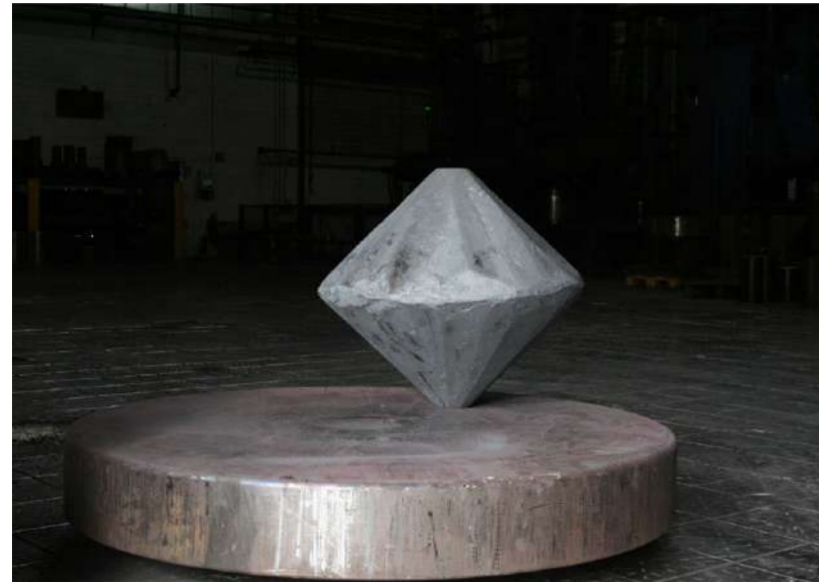
TOUPIE, 2016 Acier forgé, approximativement 800 kg