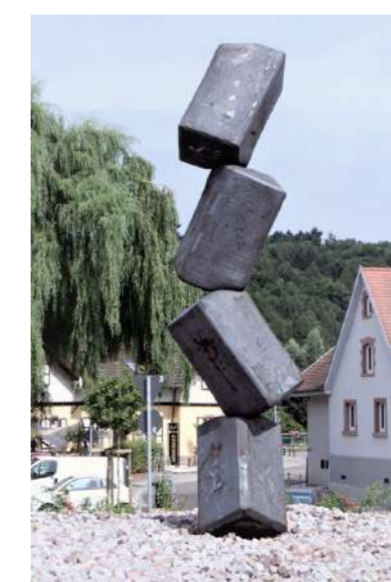
POLYEDER, 2009 PFINTAL-KLEINSTEINBACH (A) En quatre éléments, acier forgé, 500x90x90 cm, approximativement 15 tonnes