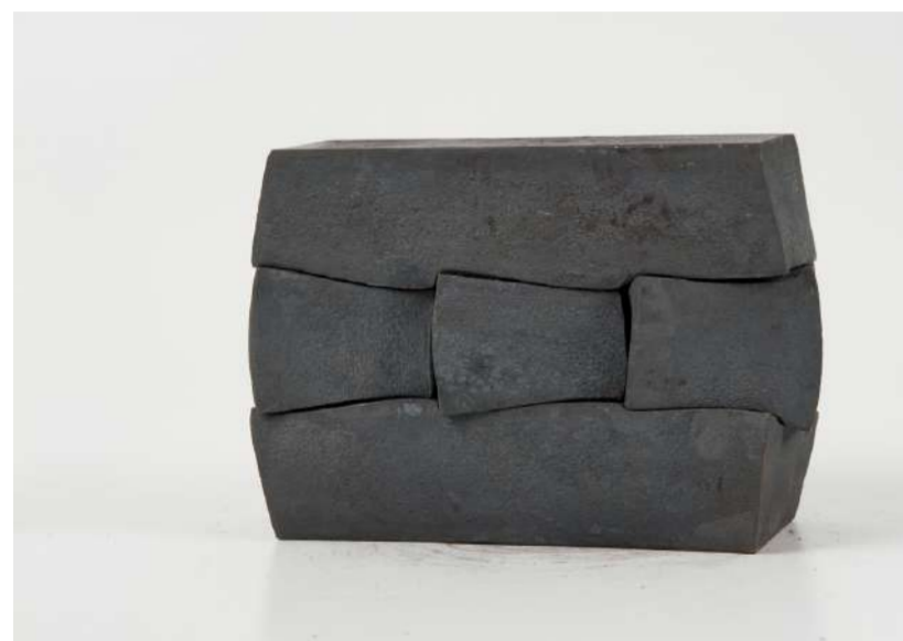
PAYSAGE, 2016 En cinq éléments, acier forgé, 12,5x18x6 cm