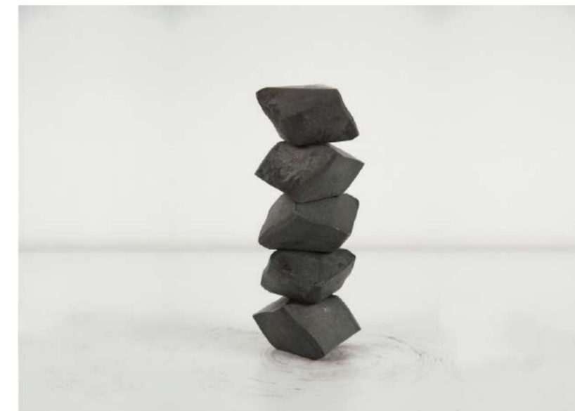
EMPILEMENTS, 2016 Acier forgé, 19x6x8 cm