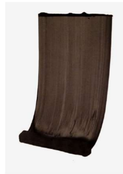
RIDEAU, 2012 Encre sur papier, 100x72 cm