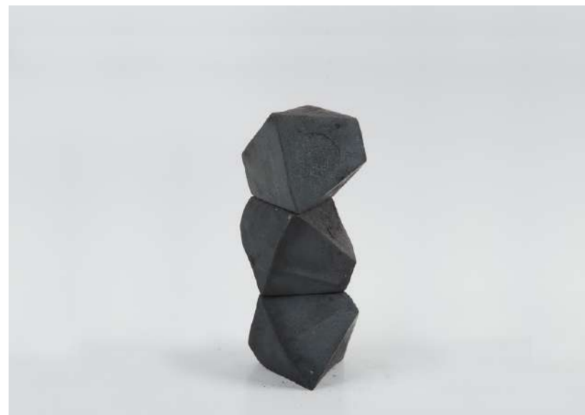
EMPILEMENT CRISTALIN, 2008 Acier forgé, 16,5x9x9 cm