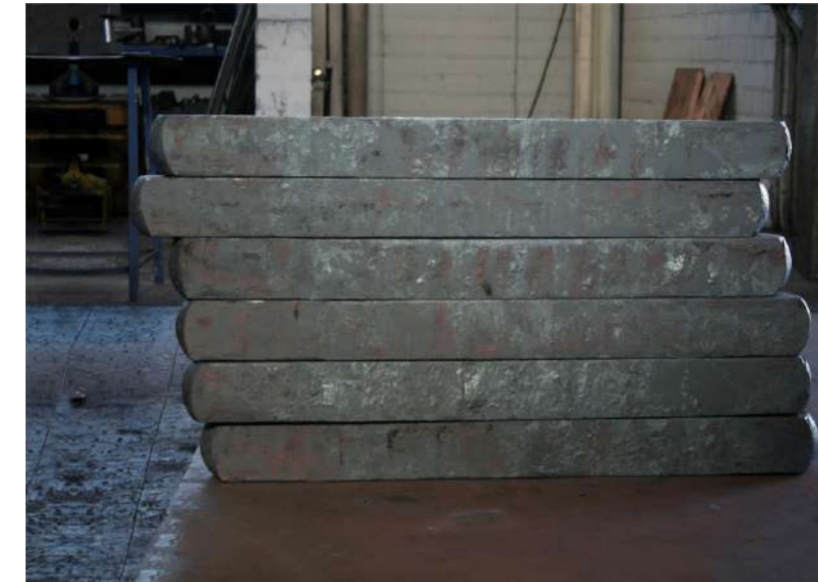
BARRIÈRES, 2016 Forge de Rosswag Acier forgé, 62x10x120 cm