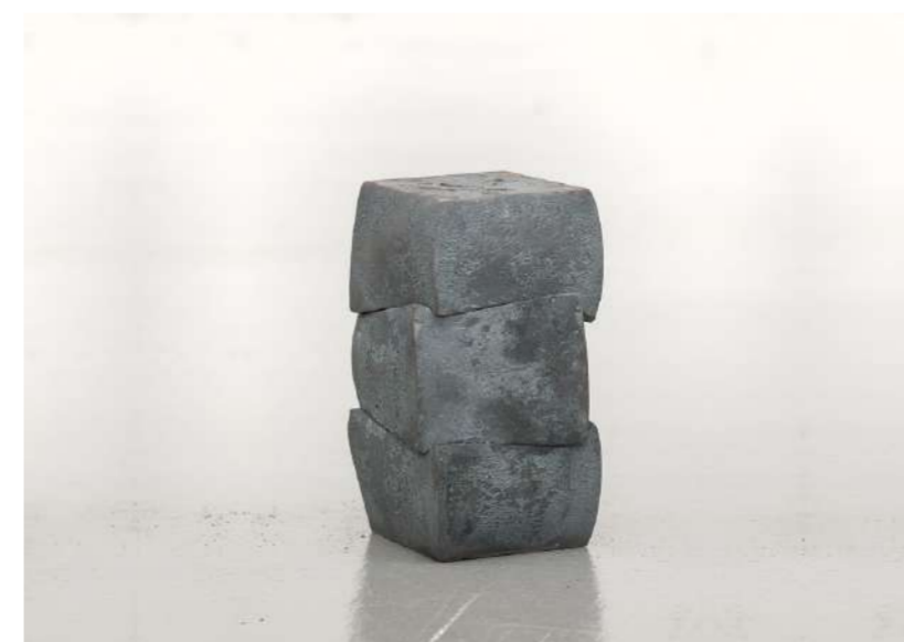
STRATES, 2012 Acier forgé, 22x12x12 cm