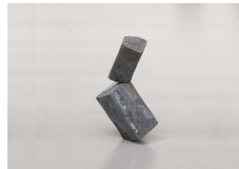
POLYEDRES, 2009-2010 Acier forgé, 50x30x17 cm