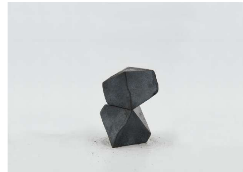
TWINS, 2006 Acier forgé, approximativement 10x9x9 cm