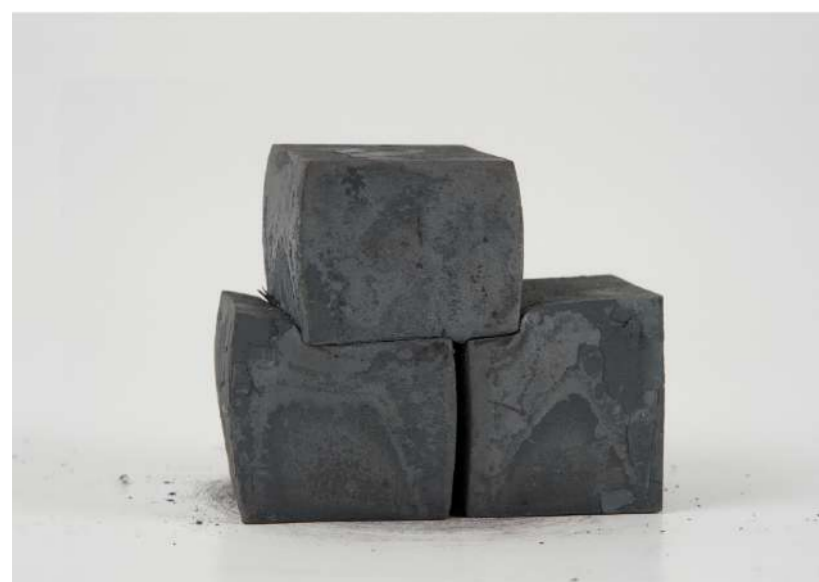
TÊTE, 2015 Acier forgé, 10,5x7x14 cm