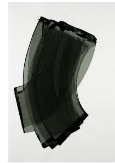
VOILE, 2014 Encre sur papier, 100x72 cm