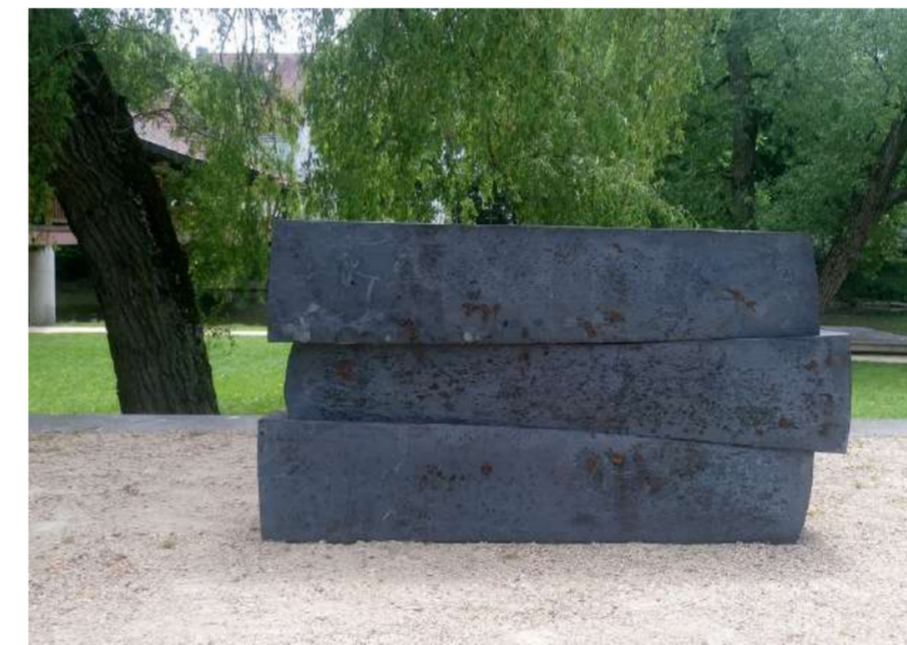
PAYSAGES, 2012-2019 TUTTLINGEN (A)