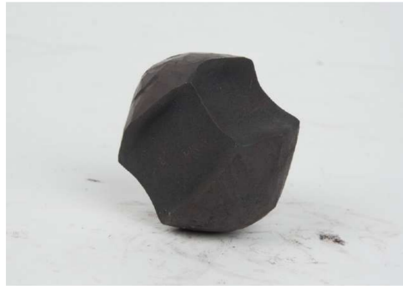
POMME, 2006 Acier forgé 10x8x8 cm