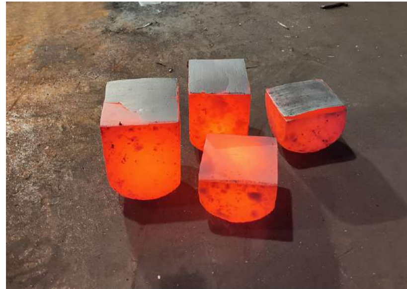
ATELIER Acier forgé inoxydable, 2021 Ets Rosswag : forge de Pfinztal (A)