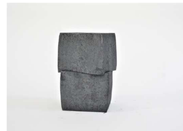
KUB+KUB, 2020 Acier forgé, 8,5x6x6 cm