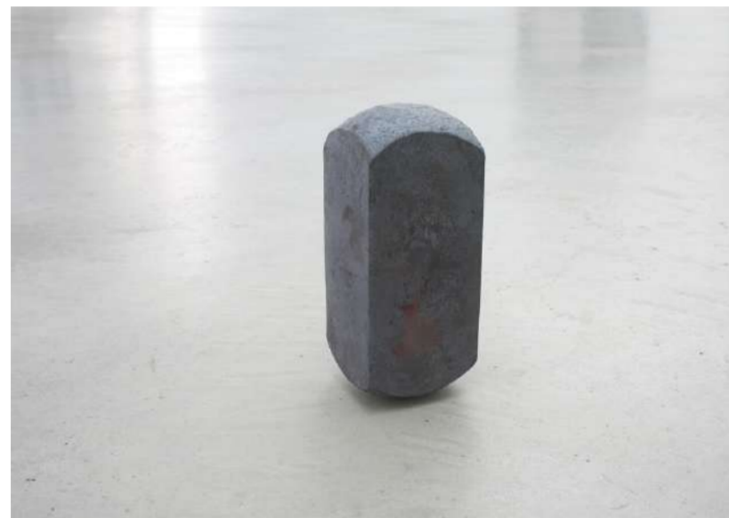
MONOLITH, 2016 Acier forgé, 20x20x8 cm