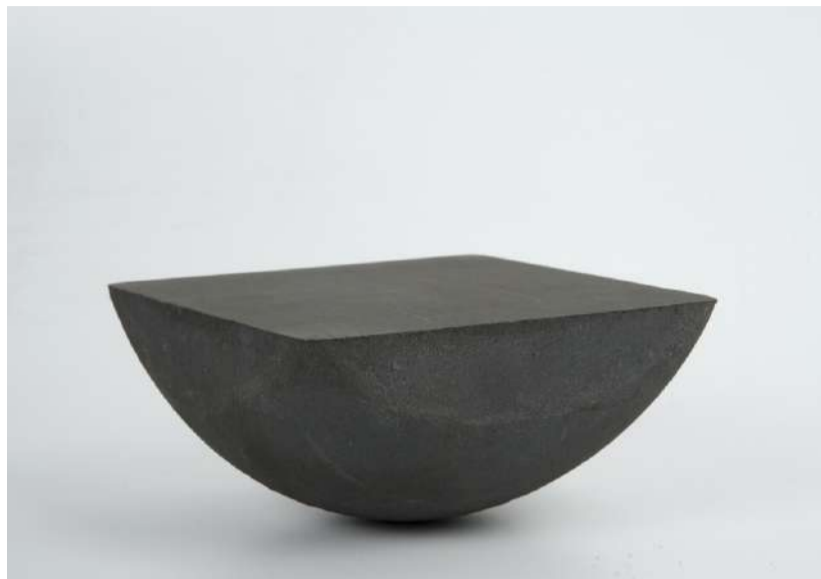
TABLE, 2018 8x15x15,5 cm