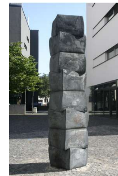
MONÁS, 2017 TUTTLINGEN (A) Acier forgé, 360x75x75cm, 15 tonnes