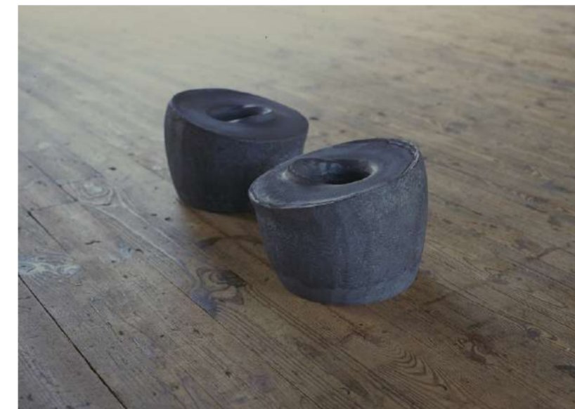
VORTEX, 2013 Acier forgé, 31x22x22 cm