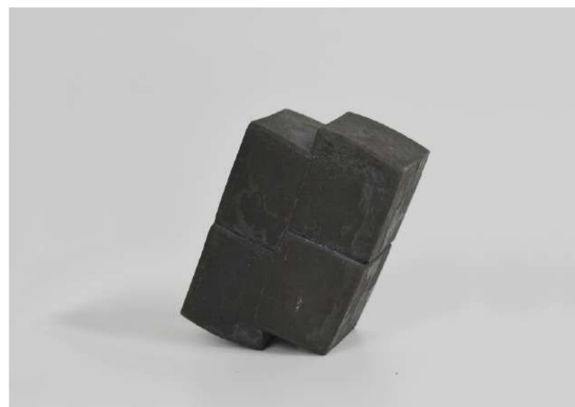
LE BAISER, 2019 Acier forgé, 12,5x8x6 cm