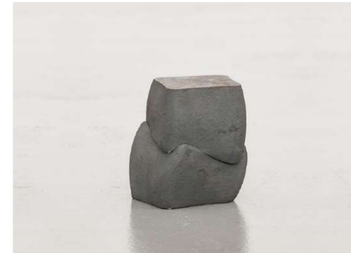
LES INSÉPARABLES, 2008 Acier forgé, 13,5x11,5x11,5 cm