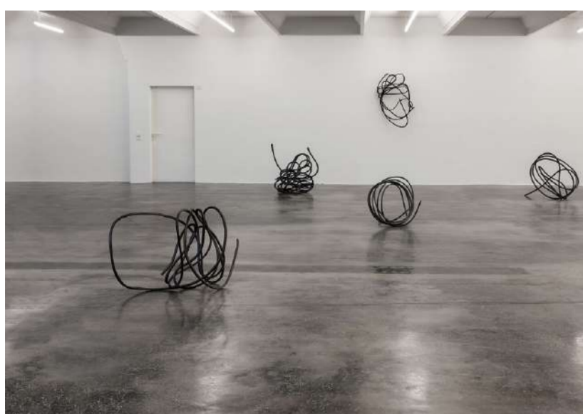
KUNSTVEREIN, 2012 REUTLINGEN (A)