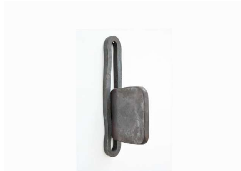
BIRTH, 2004 Acier forgé, 72x12x32 cm