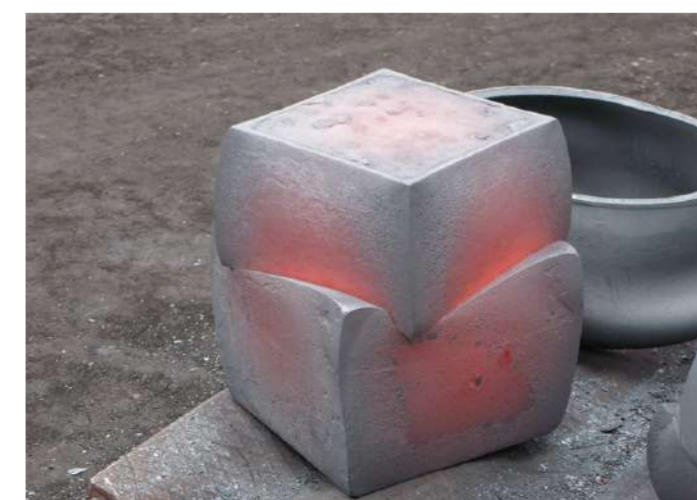
KUB+KUB, 2009 Acier forgé, approximativement 330 kg