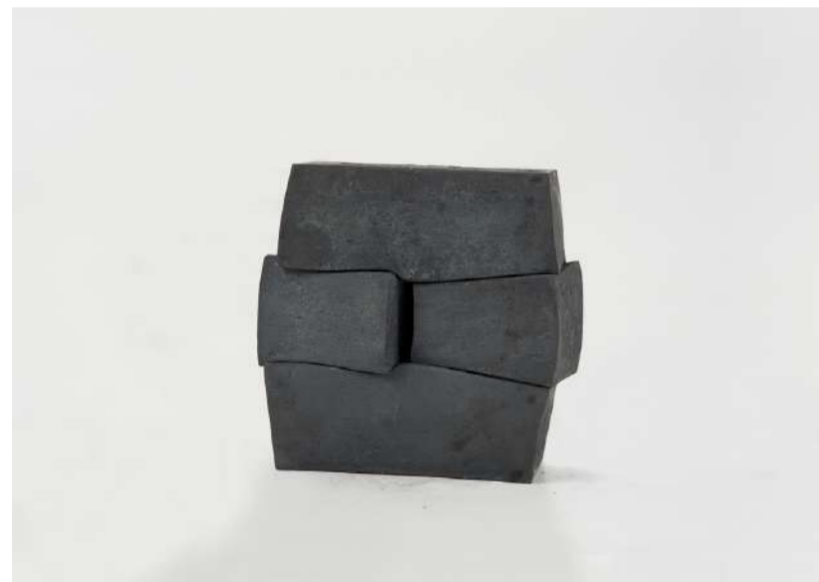
PAYSAGE, 2016 En quatre éléments, acier forgé, approximativement 15,5x14,5x6,5 cm