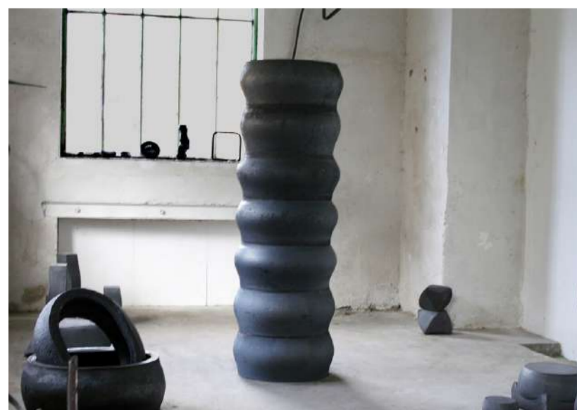
ATELIER, JUIN 2009