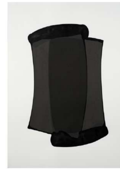
NOIR + NOIR, 2016 Encre sur papier, 100x72 cm