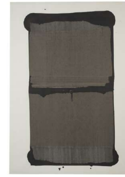
RIDEAU NOIR, 2004 Encre sur papier, 100x72 cm