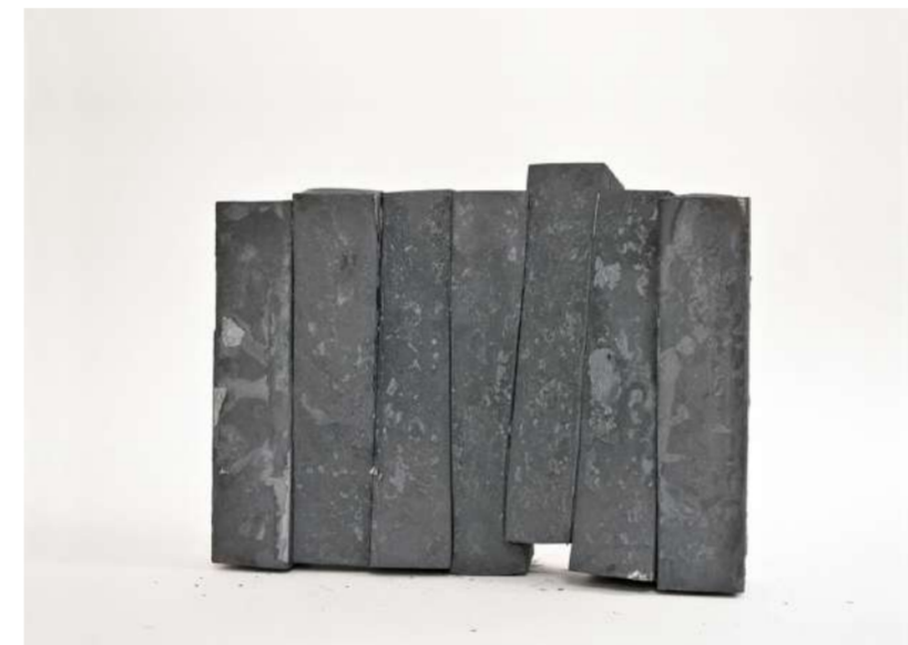
STRATES VERTICALES, 2020 Acier forgé, 22x9x30 cm