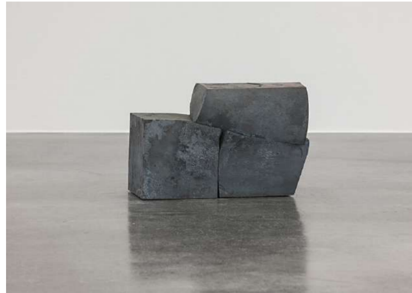
PAYSAGE, 2011 Acier forgé, approximativement 25x26x40 cm, 130 kg