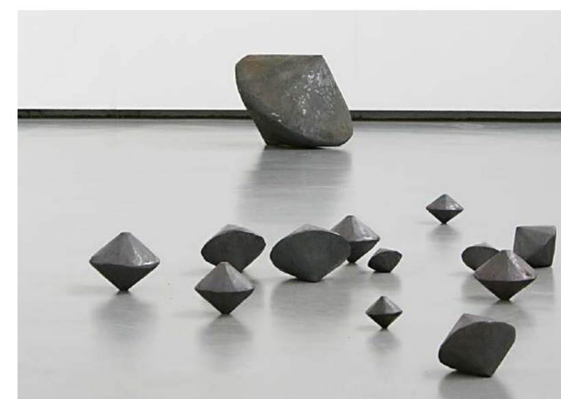
TOUPIES, 2012 Acier forgé, Centre d'art Göppingen (A)