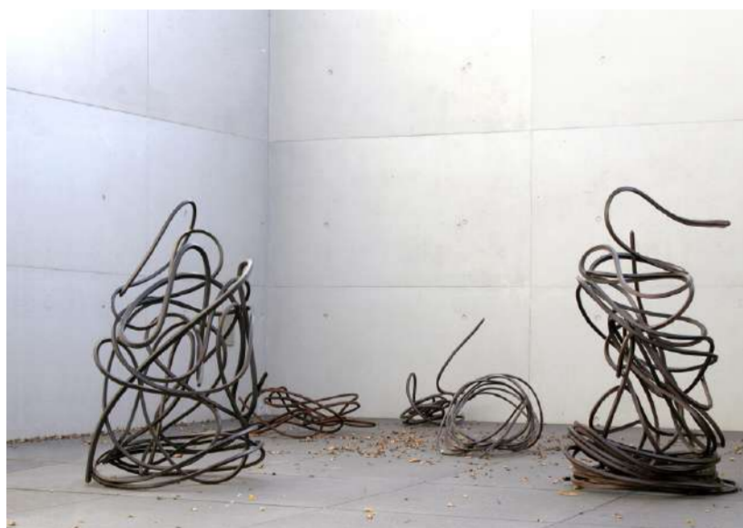
LIGNES 2008, GALERIE ABTART STUTTGART (A) 2011