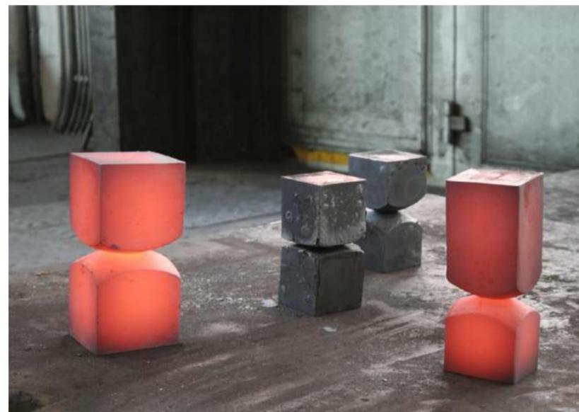
RELATION, 2017 Acier forgé, Atelier / Forges de Rosswag (A)