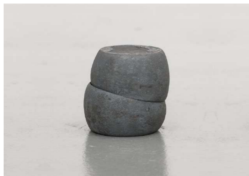
MONADE, 2012 Acier forgé, 13x12x12 cm