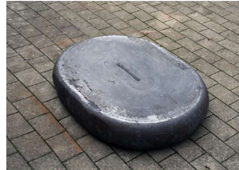
BOUCLIER, 2015 Acier forgé, approximativement 1000 kg