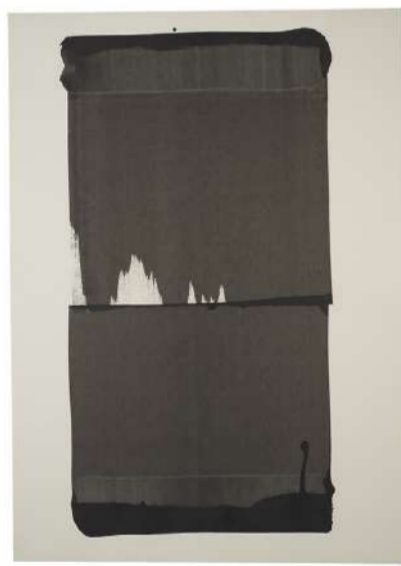
RIDEAU NOIR, 2004 Encre sur papier, 100x72 cm