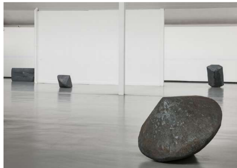
TOUPIE POINTUE, 2012 Acier forgé, 60x65x55 cm, 1200 kg Centre d'art Göppingen (A)