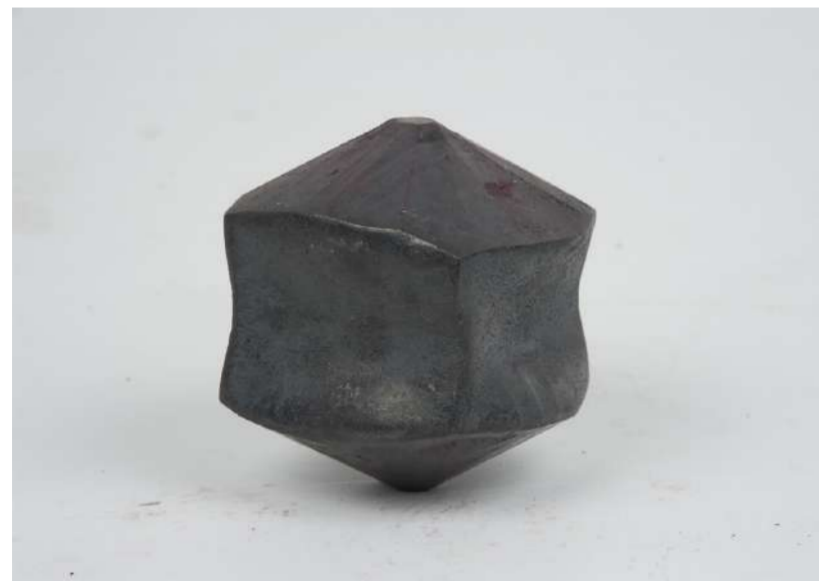
TOUPIE AFRIAPPROXIMATIVEMENTINE, 2019 Acier forgé