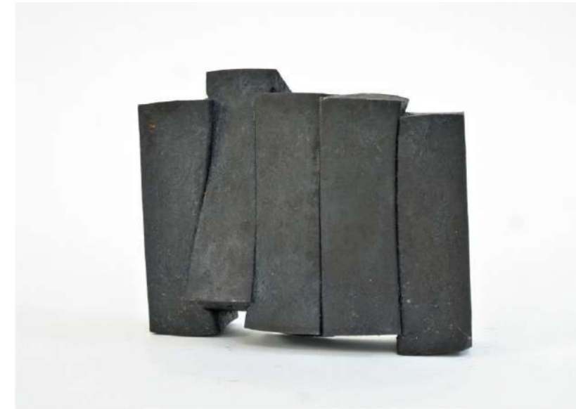
STRATES VERTICALES, 2020 Acier forgé, 13x5x6 cm