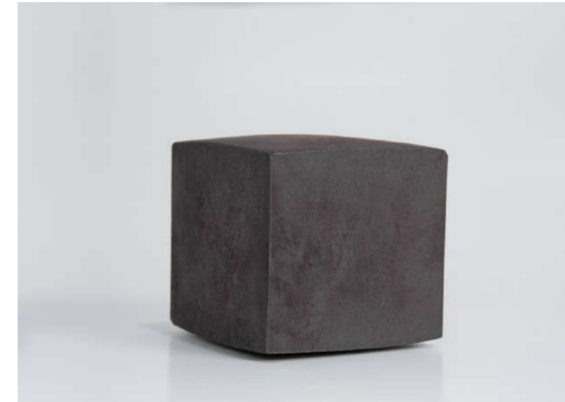
SPINNING CUBE, 2015 Acier forgé, 8,7x8,7x8,7 cm