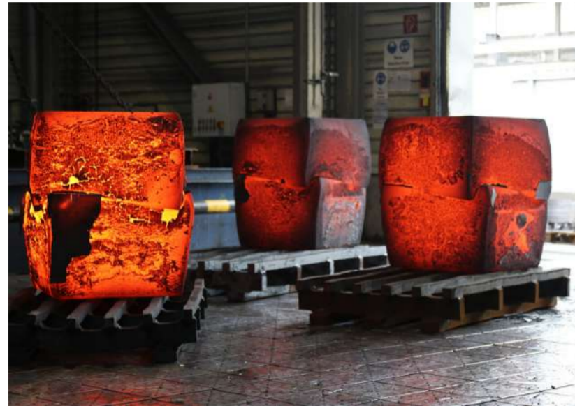
MONÁS, 2017 Forges de Rosswag, Pfintzal (A)