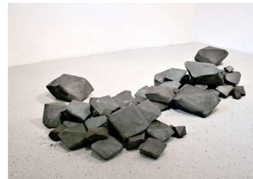
CHIRAT, 2021 Kunstforum Troadkastn, Kramsach (A)