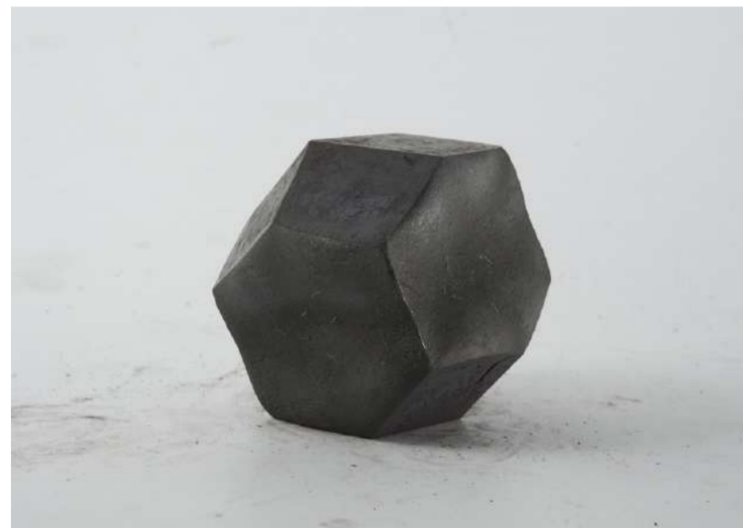
MAISON AFRIAPPROXIMATIVEMENTINE PRISMA, 2019 Acier forgé 16x12x12,5 cm