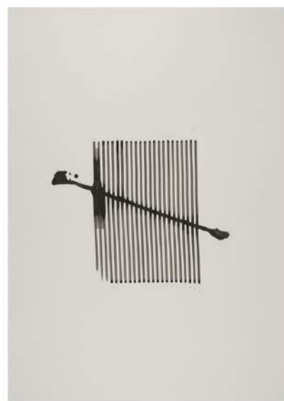
SON FILTRÉ, 2017 Encre sur papier, 101x72 cm