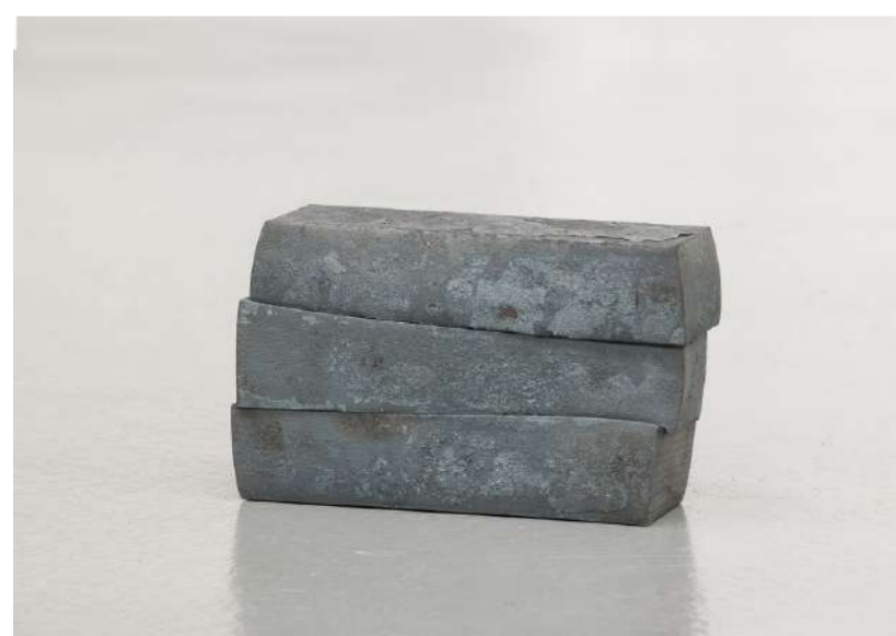
PAYSAGE DEVANT, 2012 Acier forgé, 13x20x7 cm Photo : Frank Kleinbach