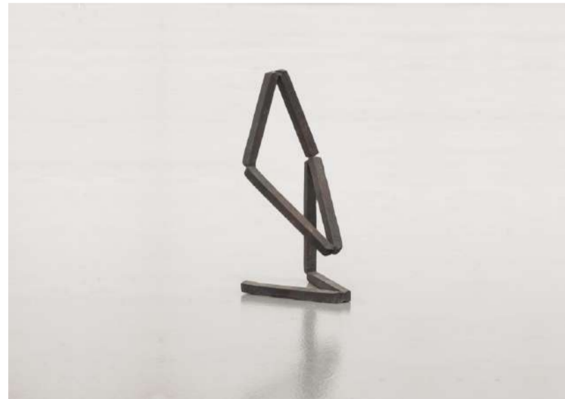
FIGURE, 1999 Photo : Frank Kleinbach