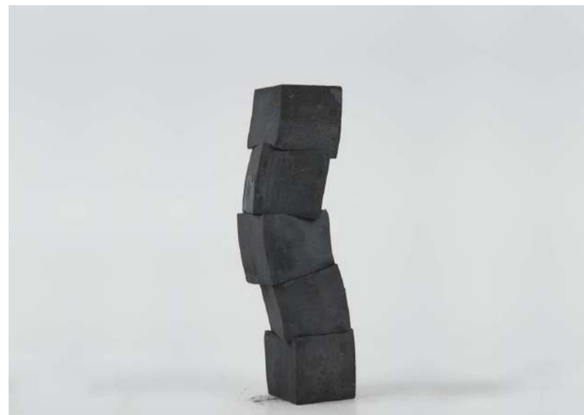
STRATE, 2012 En cinq éléments, acier forgé, 29x7x8 cm