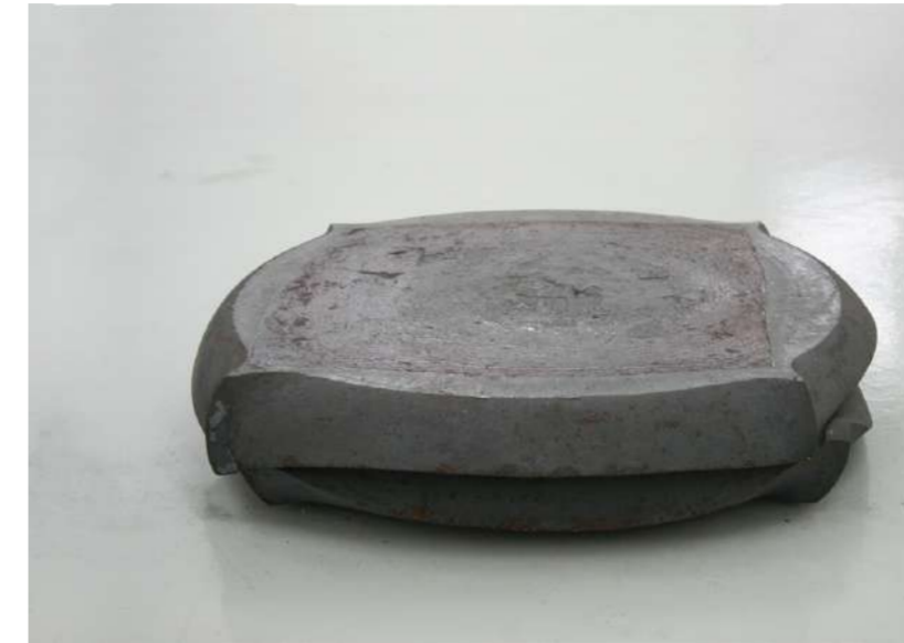
MEMOIRE, 2012 Acier forgé, 12x60x60 cm