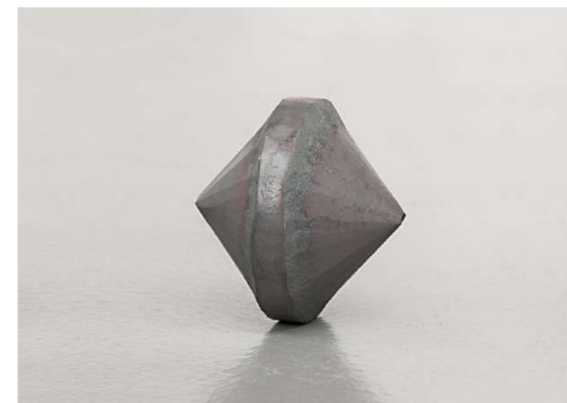
TOUPIE ROMAINE, 2011 Acier forgé, 13x13x13 cm