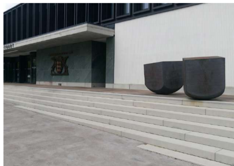
TRIBUNAL RÉGIONAL STUTTGART, STAMMHEIM (A), 2014-2018 Approximativement 20 tonnes, 130x110x100 cm