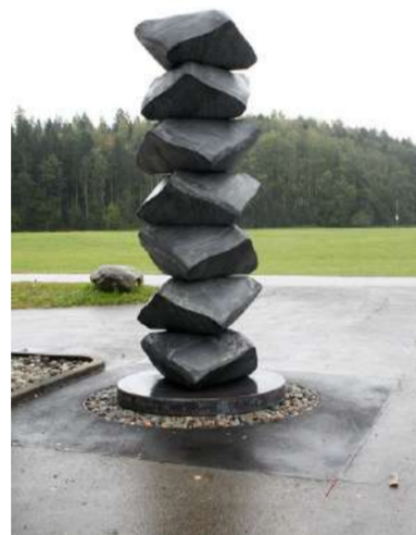
EMPILEMENTS, 2020 Hauteur 3,20 m, 14 tonnes