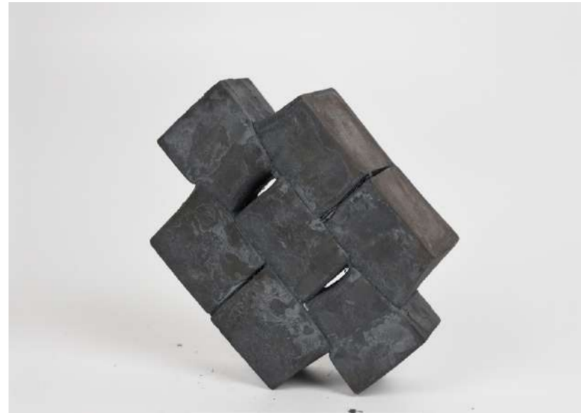
"HOMME", 2019 Acier forgé, 17,5x12x7 cm