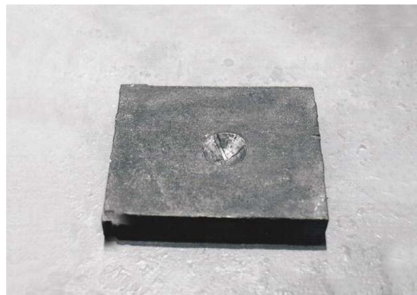
HOLE, 1988-1989 Acier taillé a la main