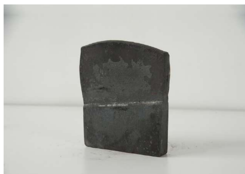
ETUDE HORIZONTALE, 2016 Acier forgé, 17x3x16 cm