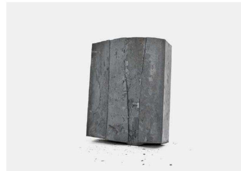
STRATES VERTICALES, 2020 Acier forgé, 22x15x8 cm