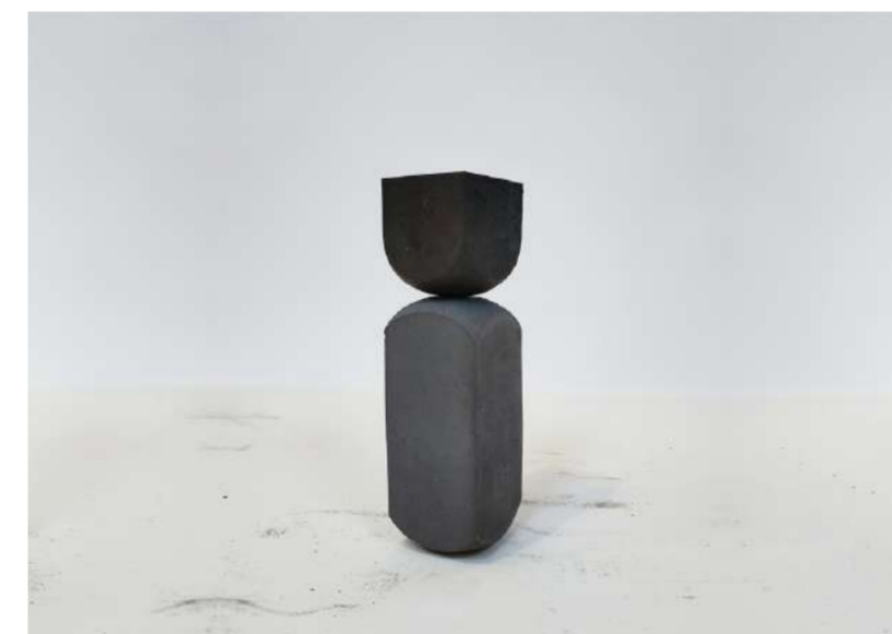
RELATION, 2021 Acier forgé, 17,5x5x5,5 cm