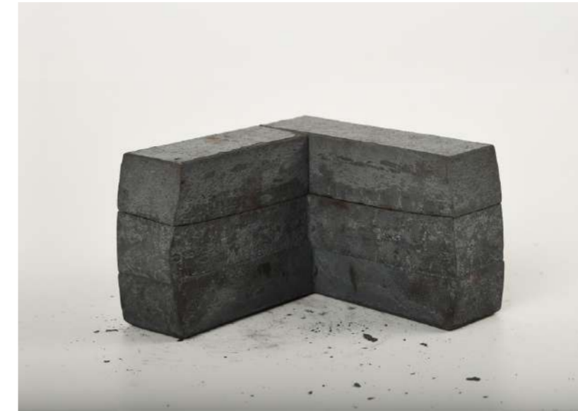
ANGLE, 2020 Acier forgé, 9,5x14,5x14,5 cm