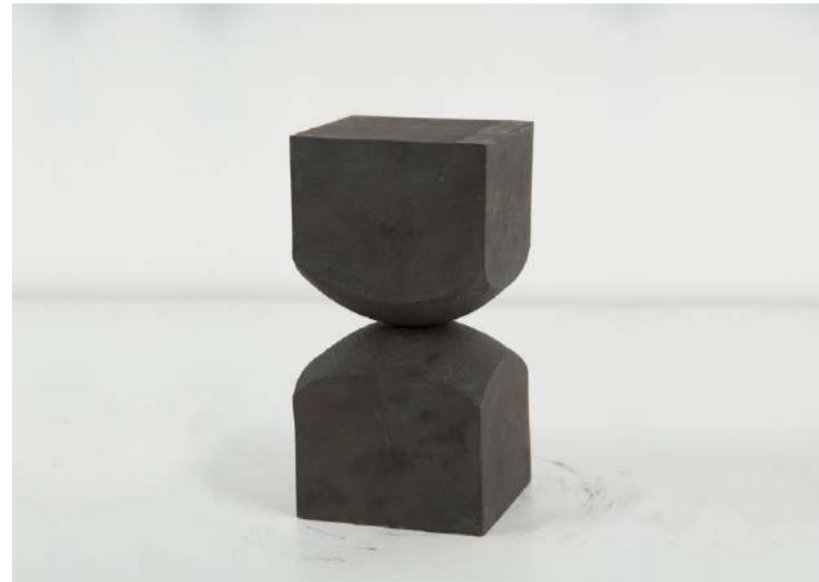
RELATION, 2017 Acier forgé, 17x7,8x7,8 cm