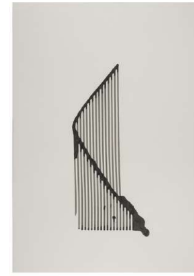
LIGNE MONTANT, 2017 Encre sur papier, 101x72 cm