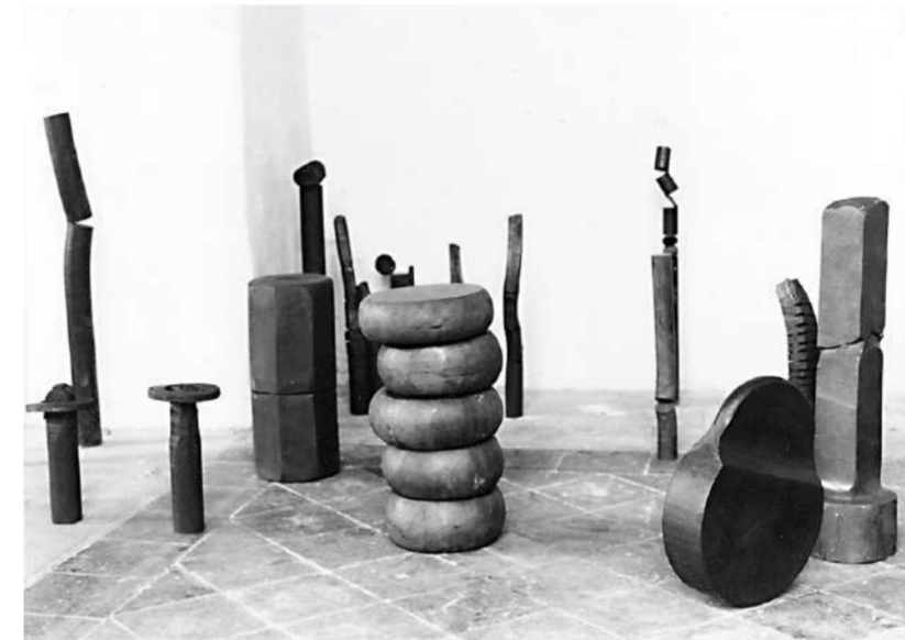
EMPILEMENT, RÉSISTANCES, 2000