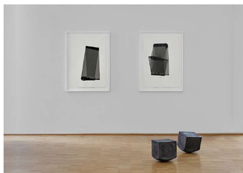
GALERIE MUNICIPALE TUTTLINGEN (A), 2018