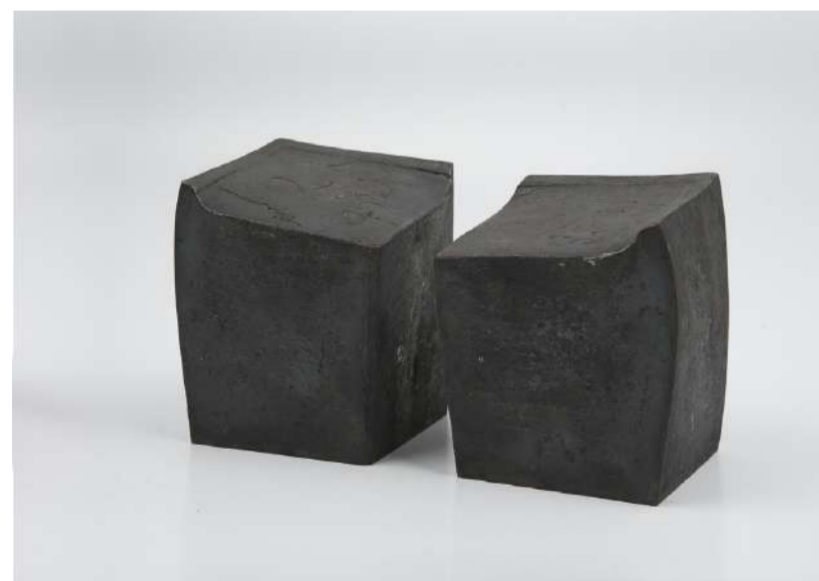
ANGLES, 2015 Acier forgé, 17x11x11 cm