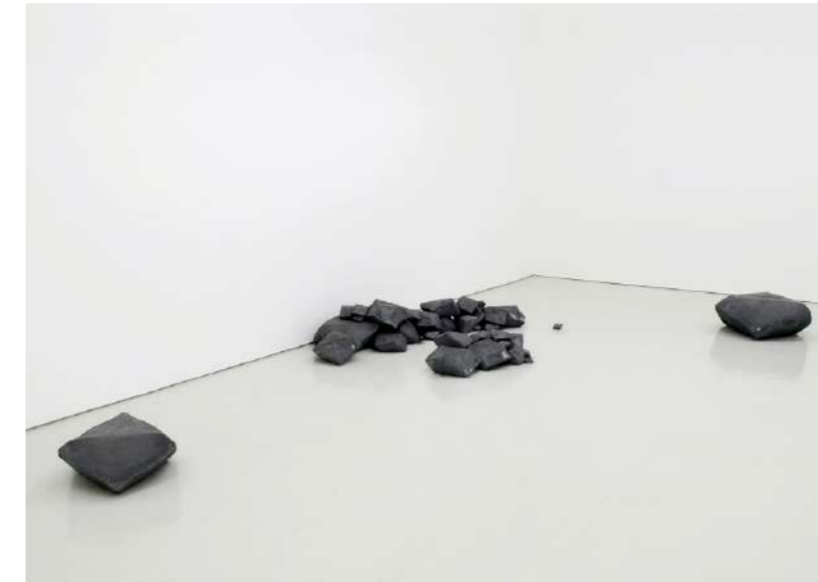
CHIRAT, 2009-2013 Acier forgé, 3000 kg Musée d'art moderne St Etienne (F) Courtesy Museum Art + Donaueschingen / Allemagne