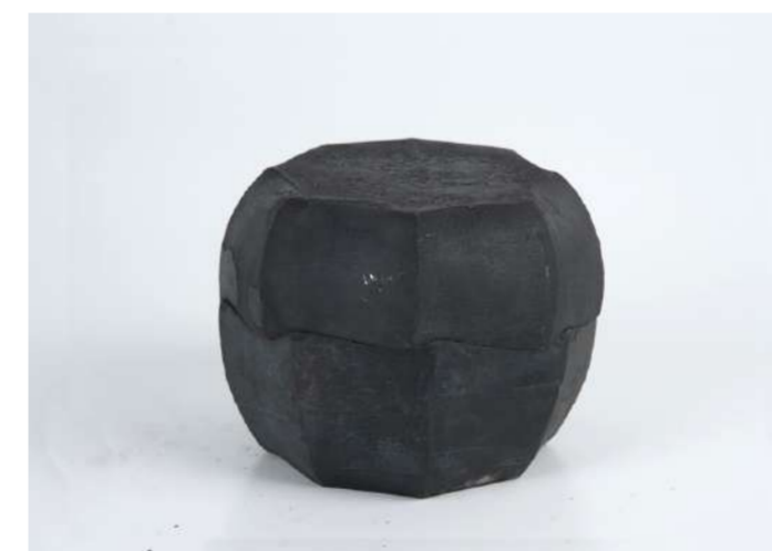
ROSE, 2015 Acier forgé, 12x20x20 cm