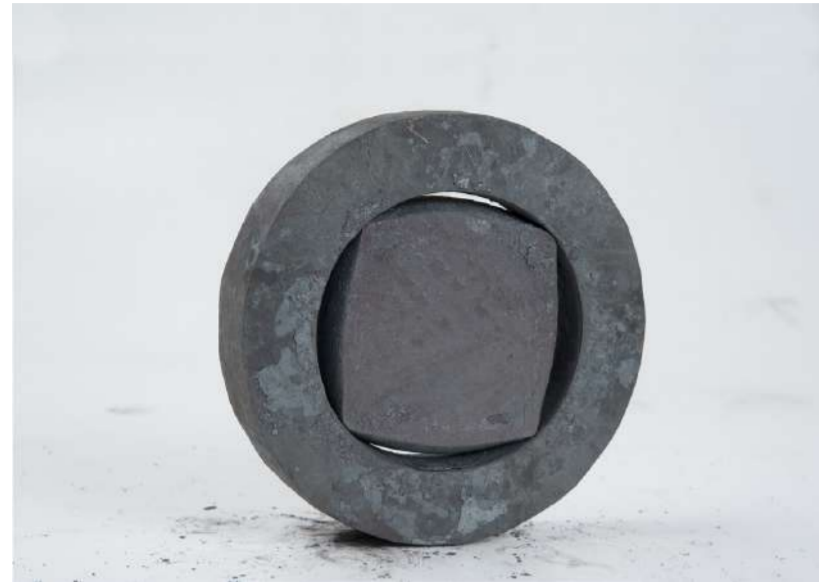
MONTURE, 2018 Acier forgé, 9x19x4 cm