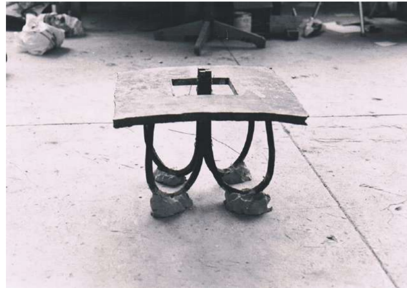
TABLE, 1990 KUNSTAKADEMIE STUTTGART (A)