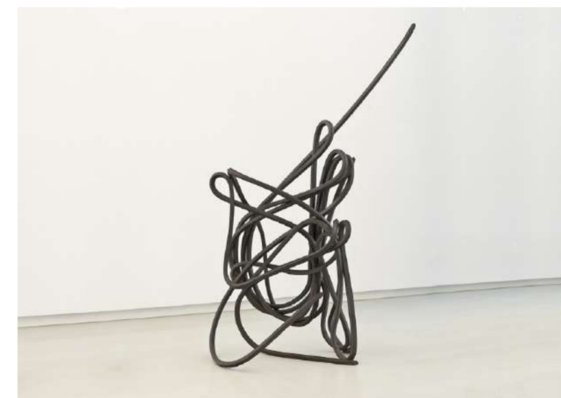
LIGNES SYAM, 2002 Acier laminé, 70x70x140 cm Syam (F)