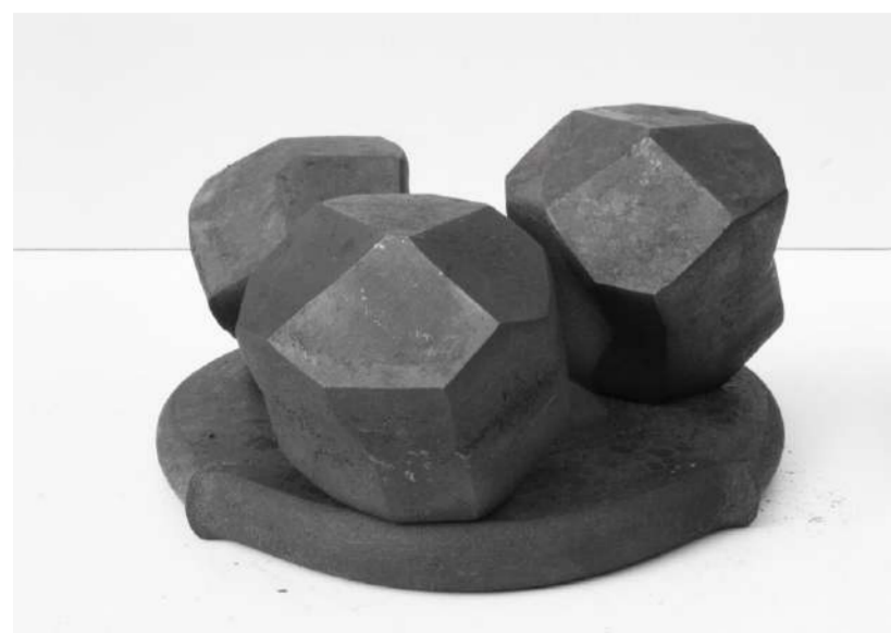
MAISONS AFRIAPPROXIMATIVEMENTINES PRISMA, 2006 Acier forgé