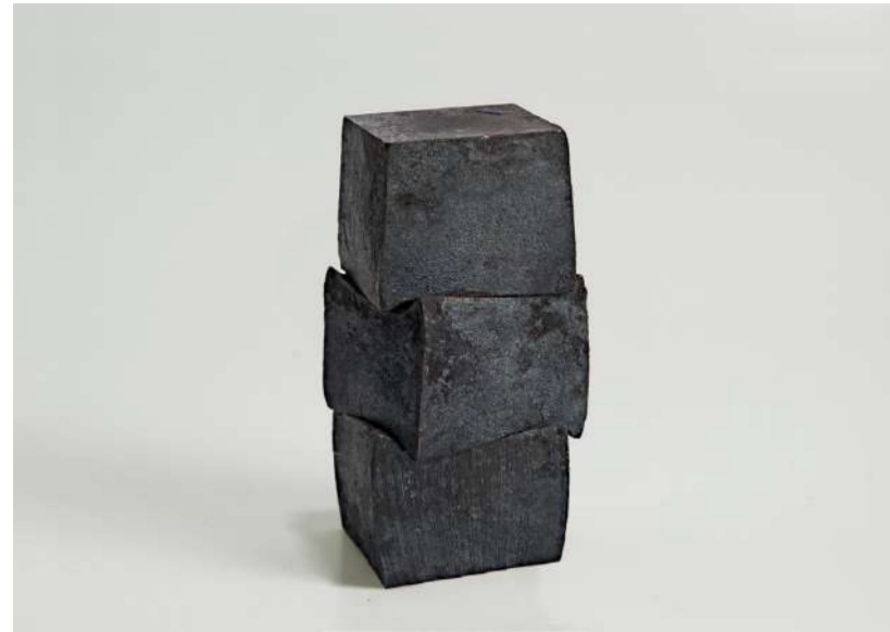
STRATE, 2012 En trois éléments, acier forgé