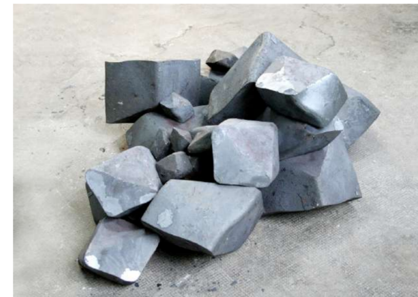
VUE D'ATELIER, 2006 Acier forgé, Courtesy Collection Museum Art + Donaueschingen (A)