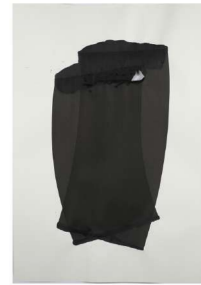
SCHWARZE 005, 2017 Encre sur papier, 100x72 cm