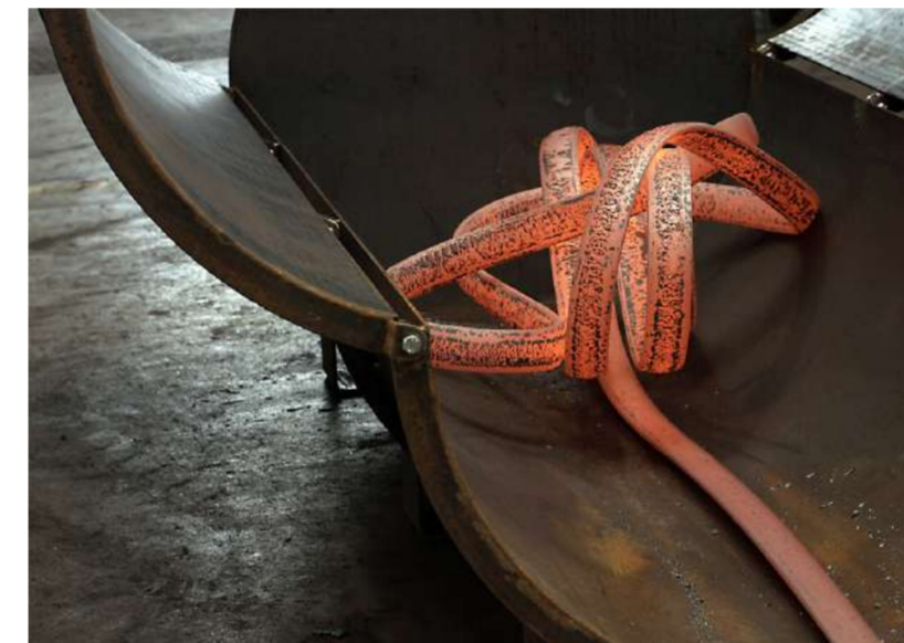
BILDSCHIRMFOTO, VIDEOSTILL, 2016 Processus de laminage