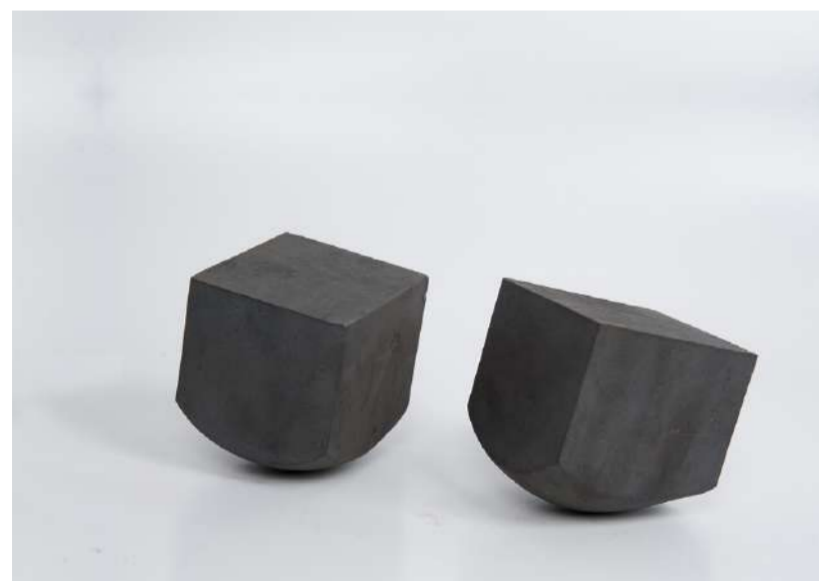
ETUDE POUR STAMMHEIM, 2016 Acier forgé, approximativement 9x9x9 cm